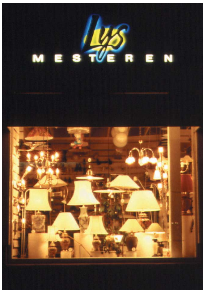
De øverste bogstaver er belyst bagfra. Nederst en lyskasse, hvor lyset kommer ud gennem bogstaverne.

* Korona er den lysende krans, man kan se omkring solen under en total solformørkelse.