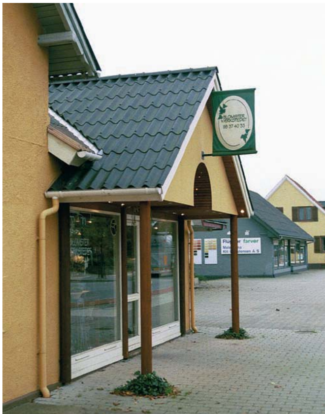
Hobrovej nr. 77. Et alternativ til den faste baldakin.