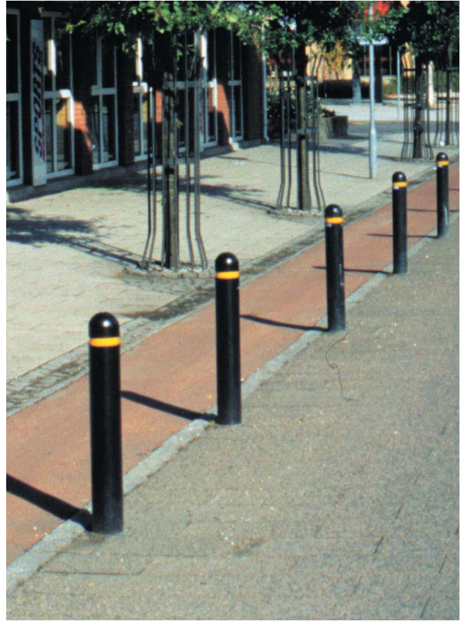
Eksempel på nuværende steler.