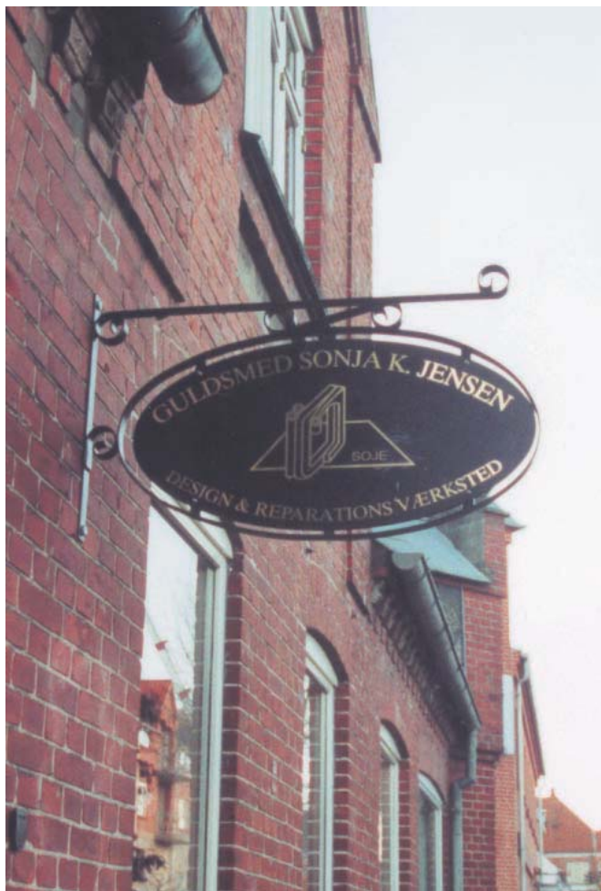
Jernbanegade nr. 6. Udhængsskilt tilpasset gadebilledet.