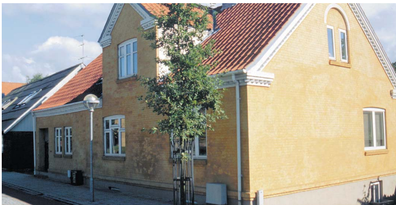
Hobrovej nr. 71. Nyrenoveret bygning.

Det er derfor kommunens håb, at alle, der ønsker at give forretningen et visuelt løft, ser det som en spændende udfordring at bidrage til forskønnelsen af byens ansigt.