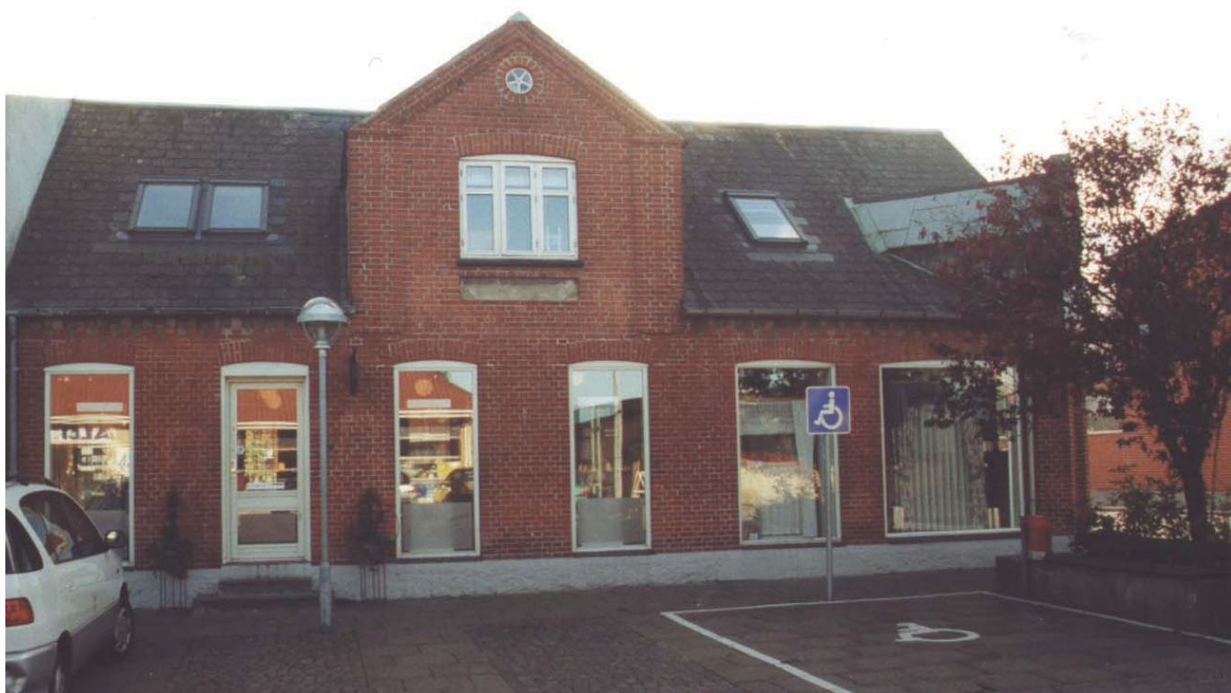
Jernbanegade nr. 6. Enkel og ukompliceret opdeling af udstillingsvinduerne.