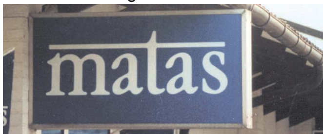
Lyskasse med lyse bogstaver på mørk baggrund giver god læsbarhed.

Lyskasser kan nemt blive dominerende og kan være vanskelige af aflæse på grund af kontrasten mellem gennemlyste og ikke gennemlyste dele. Lyskasser virker mere harmoniske, hvis lyset kommer ud gennem skrift og symboler end hvis baggrunden gennemlyses. Alle lyskasser kræver dog omhyggelig tilpasning til facaden for ikke at virke klodsede om dagen.