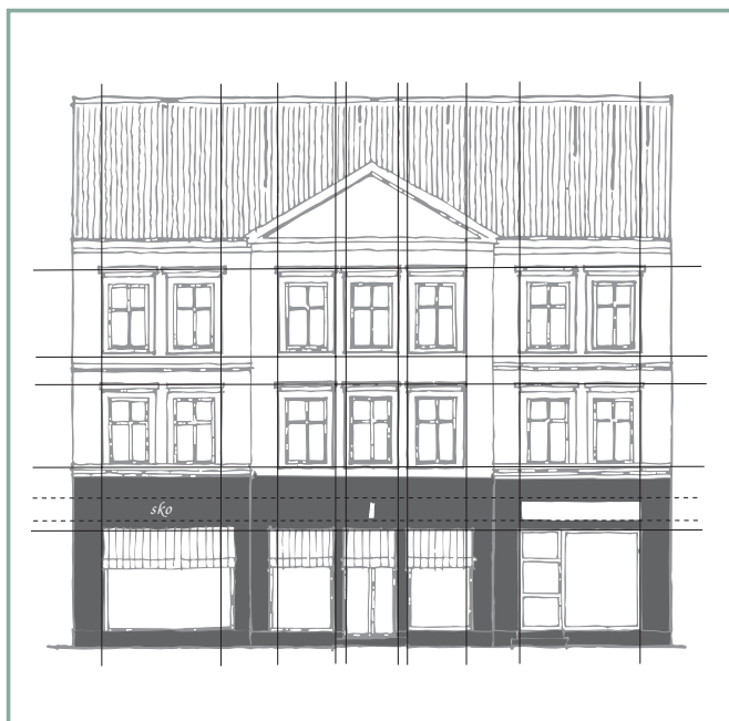
Forretningsfacaden skal forholde sig til husets lodrette og vandrette linier og skabe god balance i det samlede udtryk.