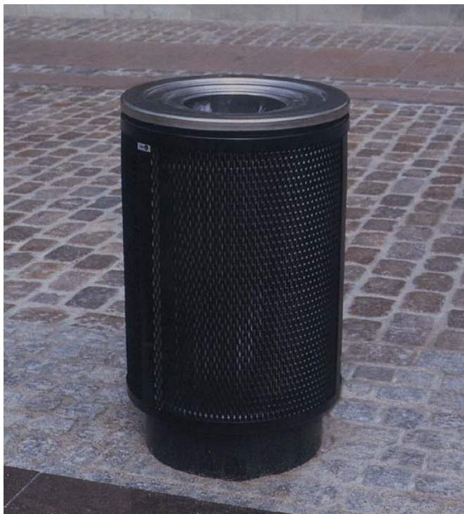
Eksempel på affaldskurv.