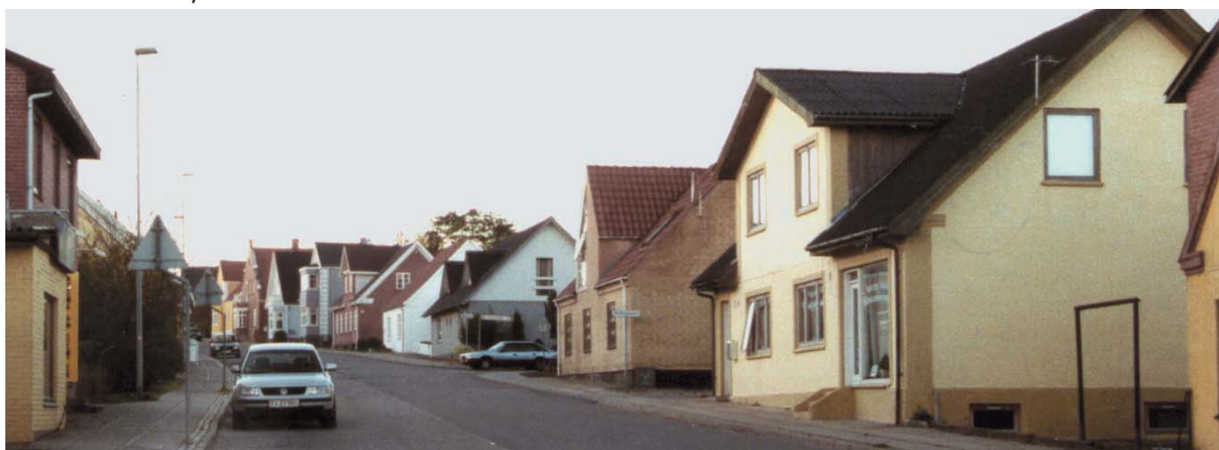
Vue ad Viborgvej med facader i forskellige pastelfarver.

Skiltning på facader bør naturligvis afstemmes farvemæssigt, så den fremstår harmonisk i forhold til den samlede facade. Dvs. at skrigende og grelle farver bør undgås.