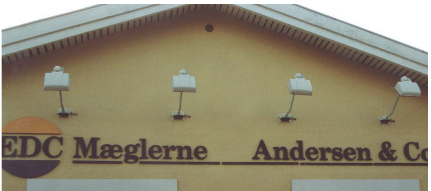
Hobrovej nr. 48. Skiltning med løse bogstaver opsat direkte på muren.