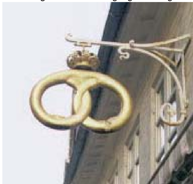
Udhængsskilt med stiliseret vare.