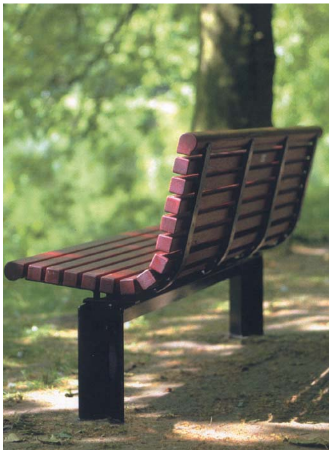
Eksempel på den udvalgte bænk model PB3001.

Selv om nogle af de eksisterende elementer enkeltvist betragtet er udmærkede, er det hensigtsmæssigt for et ordentligt og pænt udseende at arbejde med standarder for hvilke typer der skal