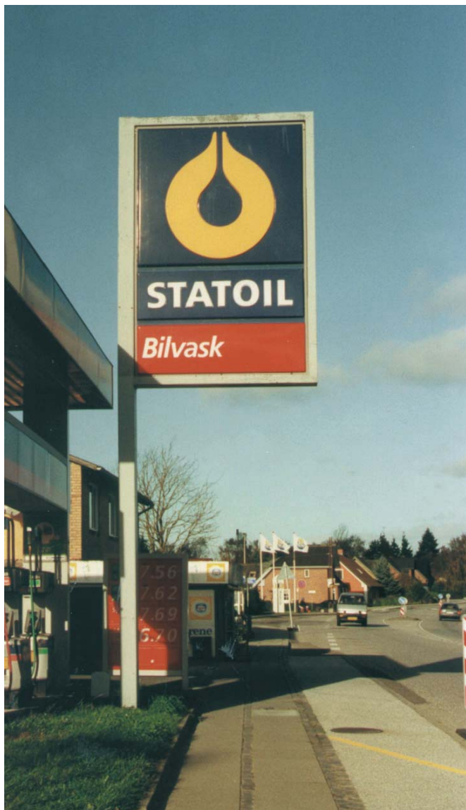
Standerskilte kun ved servicestationer.