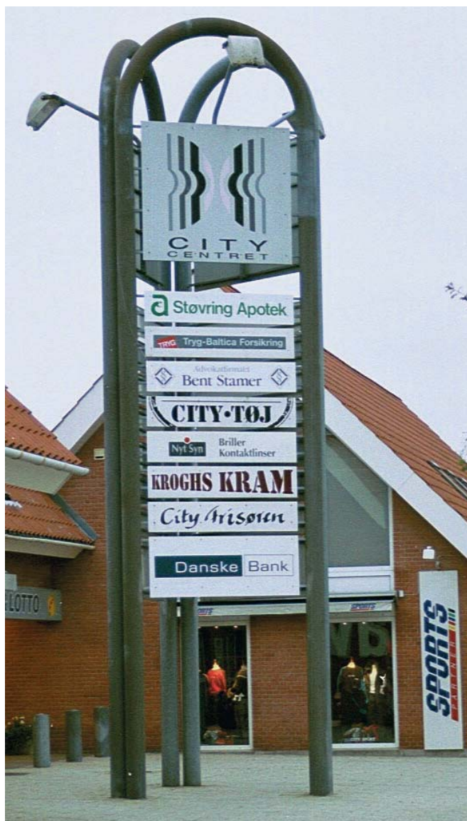
Skiltestativ ved Citycentret.