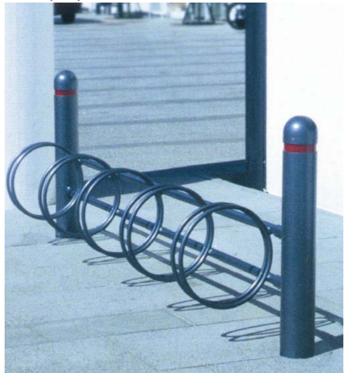
Eksempel på cykelstativ.