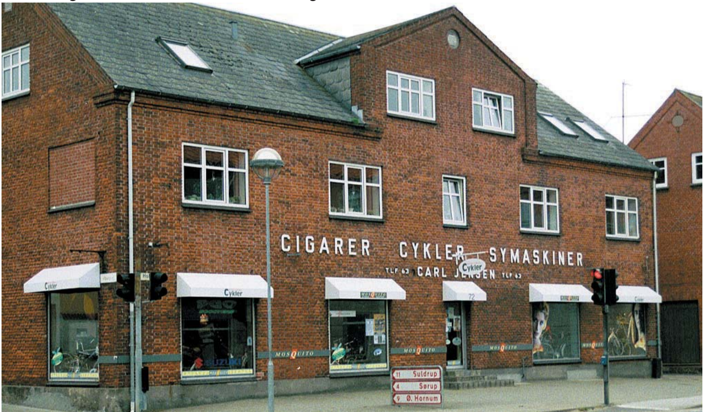
Hobrovej nr. 72. Et gammelt hus med en fin og taktfuld facade.