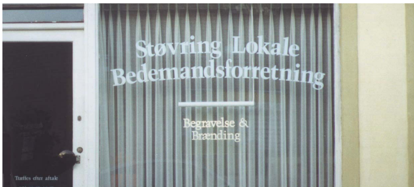
Eksempel på tekst direkte på vinduet. Viborgvej nr. 10.

Ved valg af skriftstørrelse kan man som tommelfingerregel gå ud fra, at en enkel og velproportioneret skrift kan læses på en afstand af op til 250 gange skriftens højde. Fx kan en 10 cm høj skrift læses på 25 meters afstand.