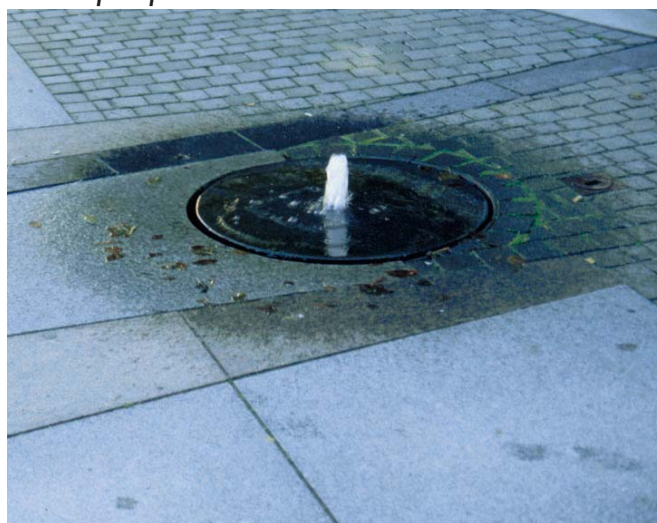
Eksempel på diskret vandkunst.