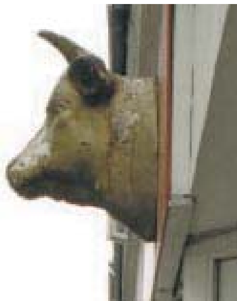
Udhængsskilt med klart signal.

Udhængsskilt og facadeskilt supplerer hinanden godt. Udhængsskiltet kan i symbolsk form fortælle om forretningen, og facadeskiltet kan derefter, når man kommer tættere på, give yderligere oplysninger. Udhængsskilte, kan med fordel ophænges så de kan bevæge sig i vinden.