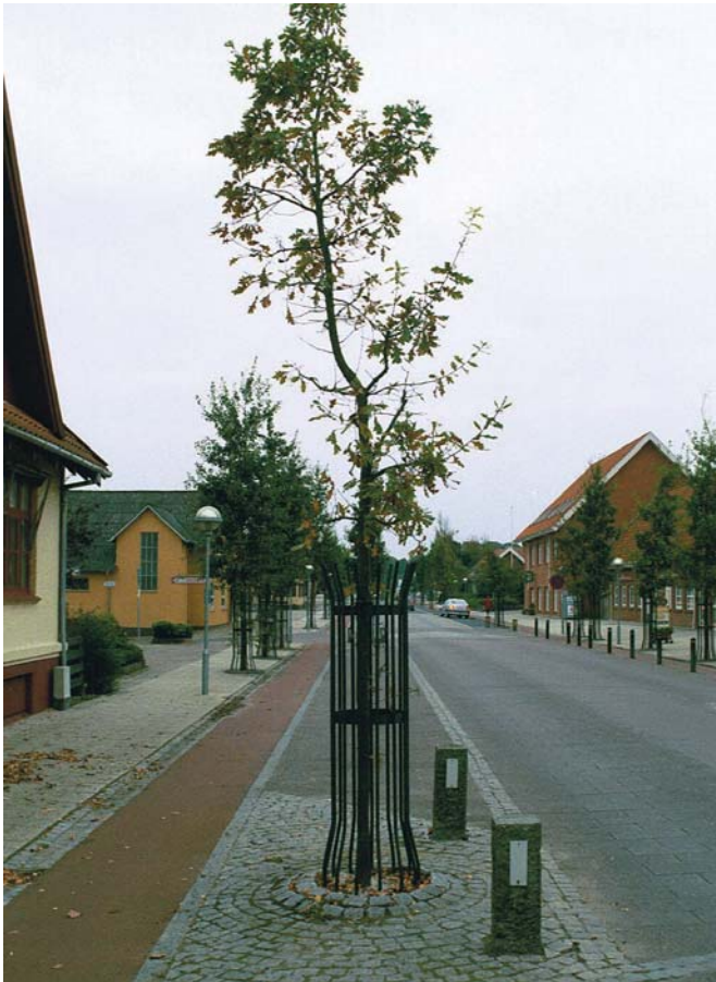
Eksempel på nuværende træbeskytter og steler.