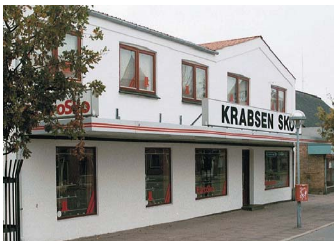
Faste baldakiner må ikke opsættes.