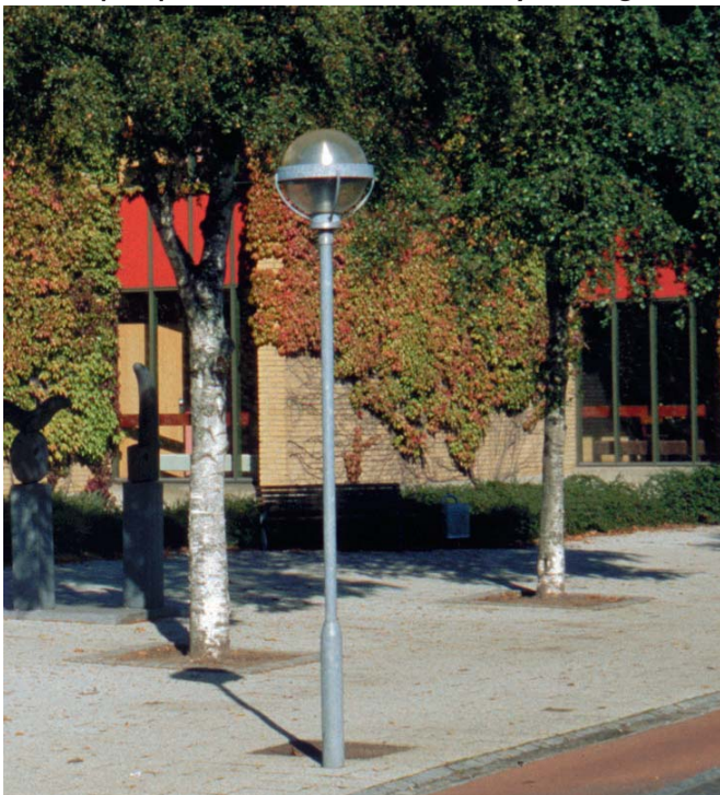
Eksempel på nuværende belysningsarmatur.