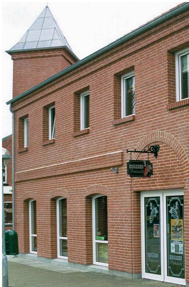
Jernbanegade nr. 4. Bevægeligt udhængsskilt.