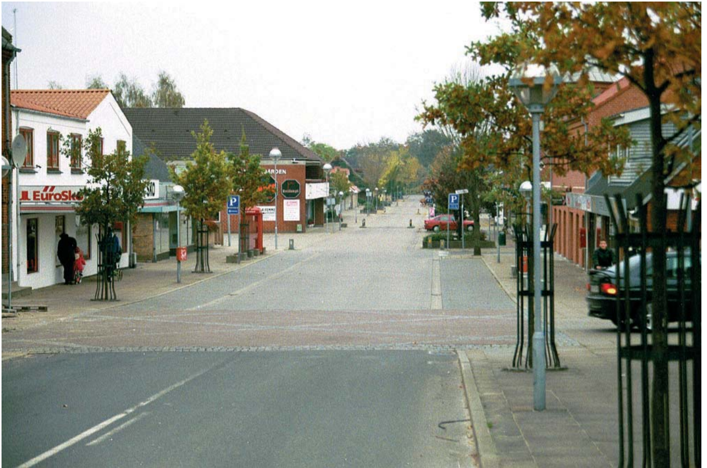
Allétræer på Jernbanegade.