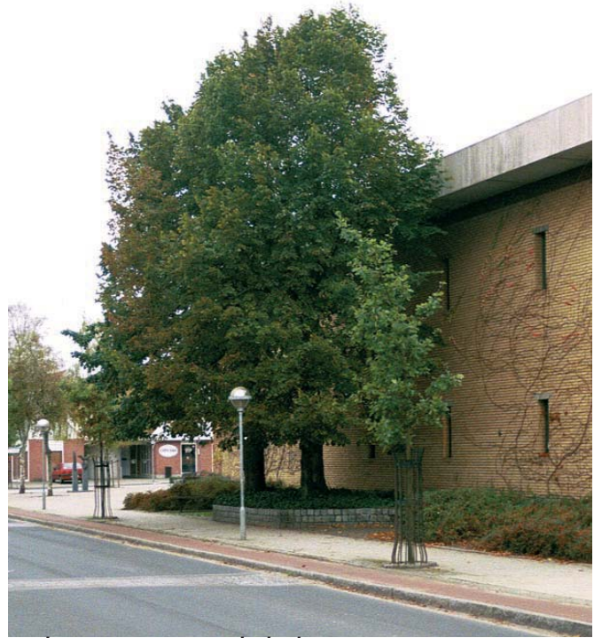
Solitære træer ved skolen.