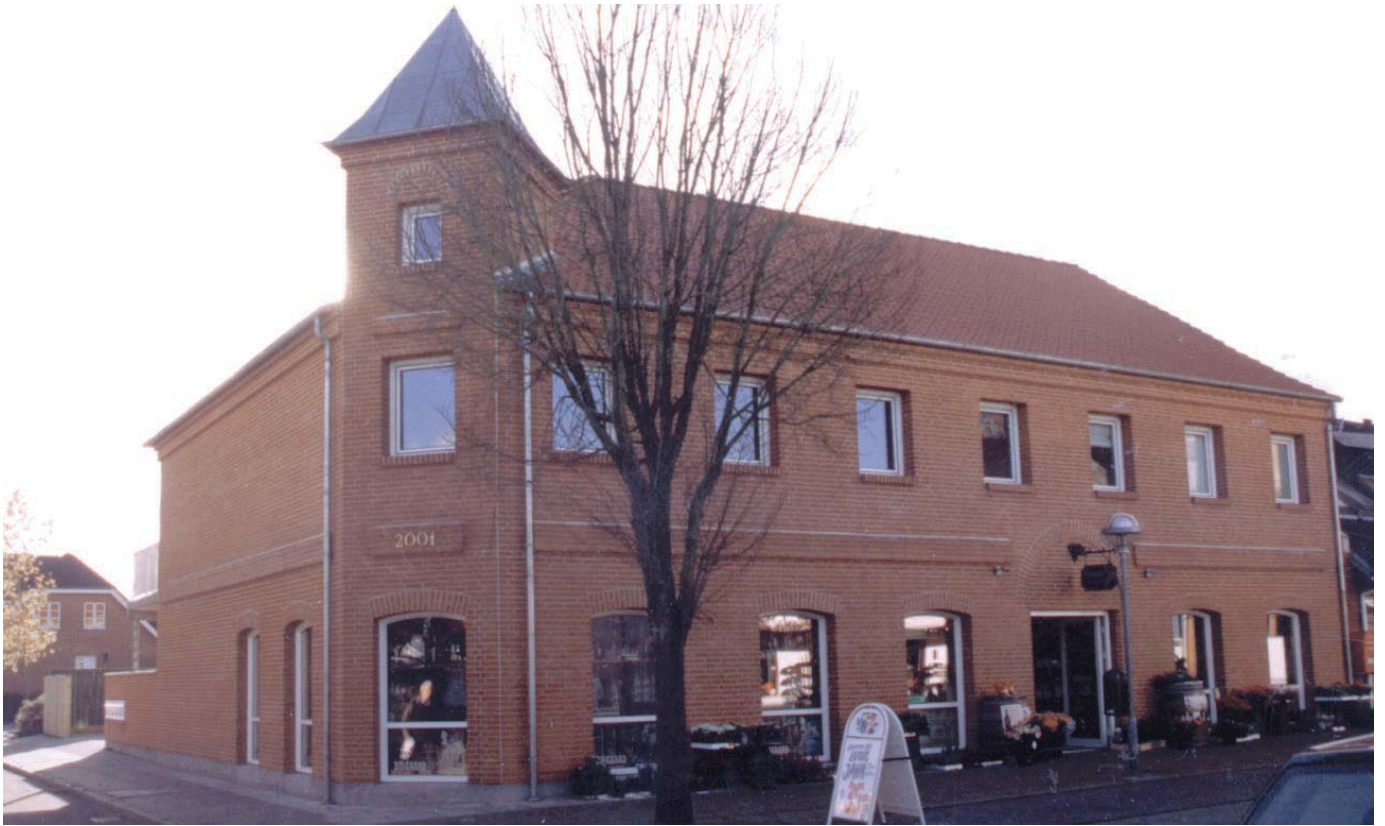
Jernbanegade nr. 4. Et moderne hus med gamle stilmotiver.