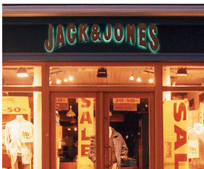
Løse bogstaver belyst bagfra har god læsbarhed (koronavirkning).