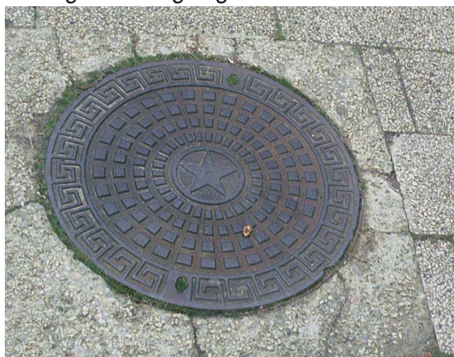
Eksempel på brønddæksel.