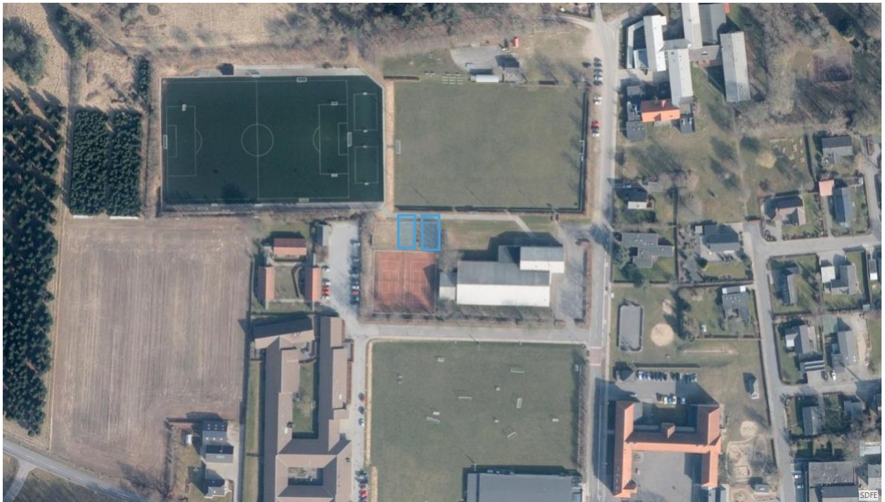
Figur 1: Oversigtskort der viser cirka placering af padelbane (lyseblå markering).

Rebild Kommune, Center Natur og Miljø har modtaget ansøgning om miljøvurdering vedrørende etablering af nye padelbaner i Bælum.