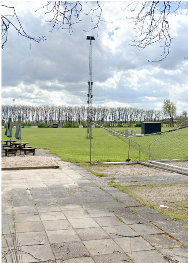
Boldbaner ved Foreningshuset