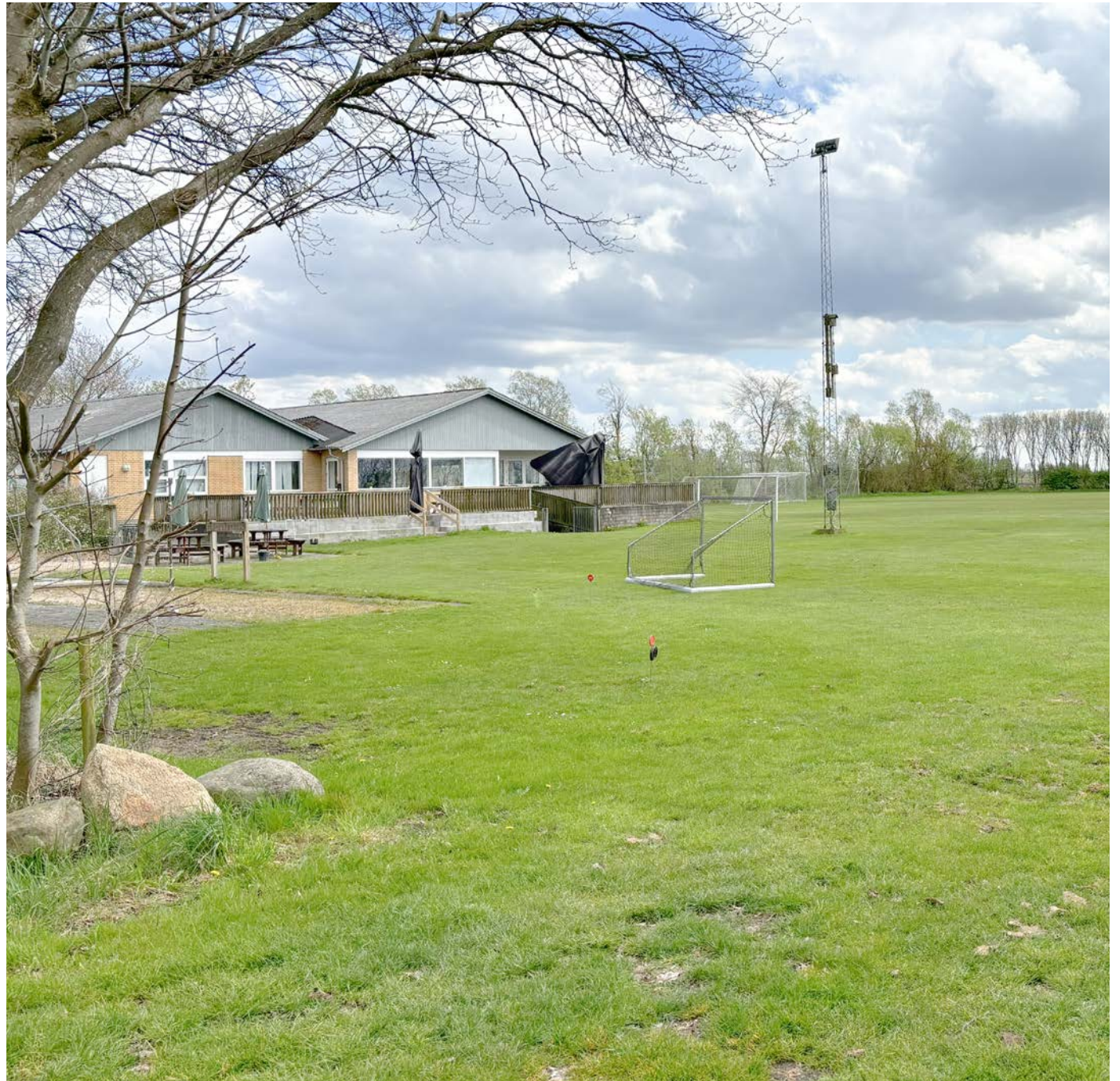
Boldbaner ved Foreningshuset