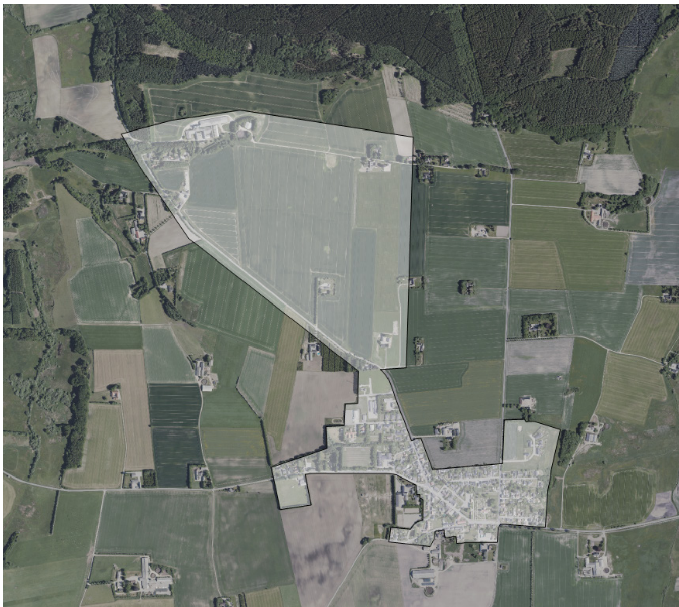
Afgrænsningen for områdefornyelsen

Områdefornyelsen indholder tiltag, som sammentænkt giver en forstærkning af de centrale steder i byen. Områdefornyelsen arbejder med området omkring skolen, som ligger nær foreningshuset. Indsatsen byforskønnelse arbejder med at skabe en smukkere by, og den tager bl.a. fat i de centrale adgangsveje til byen, og arbejder med forskønnelse af disse. Herunder Bygaden, som er vejen der forbinder Foreningshuset og Skolens arealer.