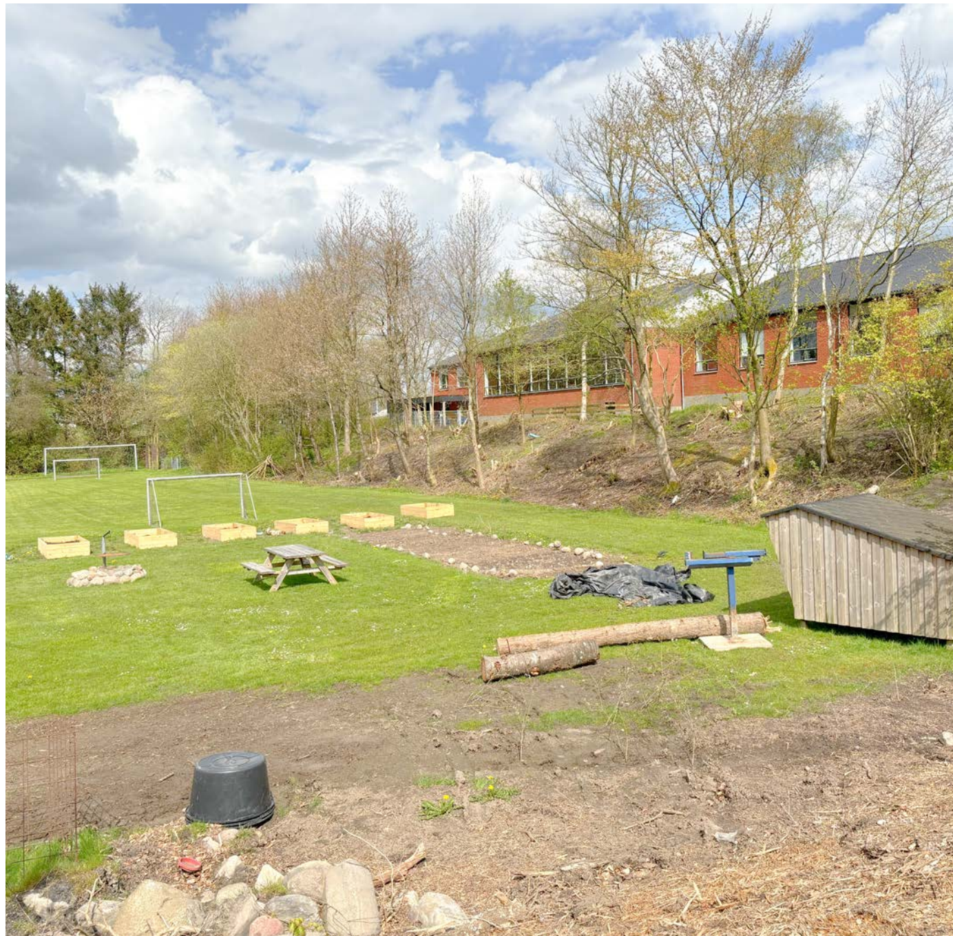
Boldbanerne + udendørs areal til skolen