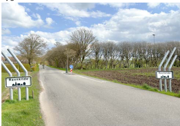
Adgangsvej til Ravnkilde