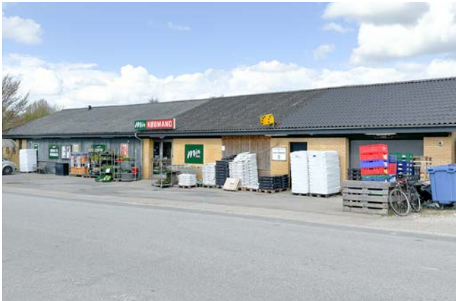
Den lokale købmand