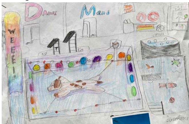
Tegning - Inddragelse af skolebørnene