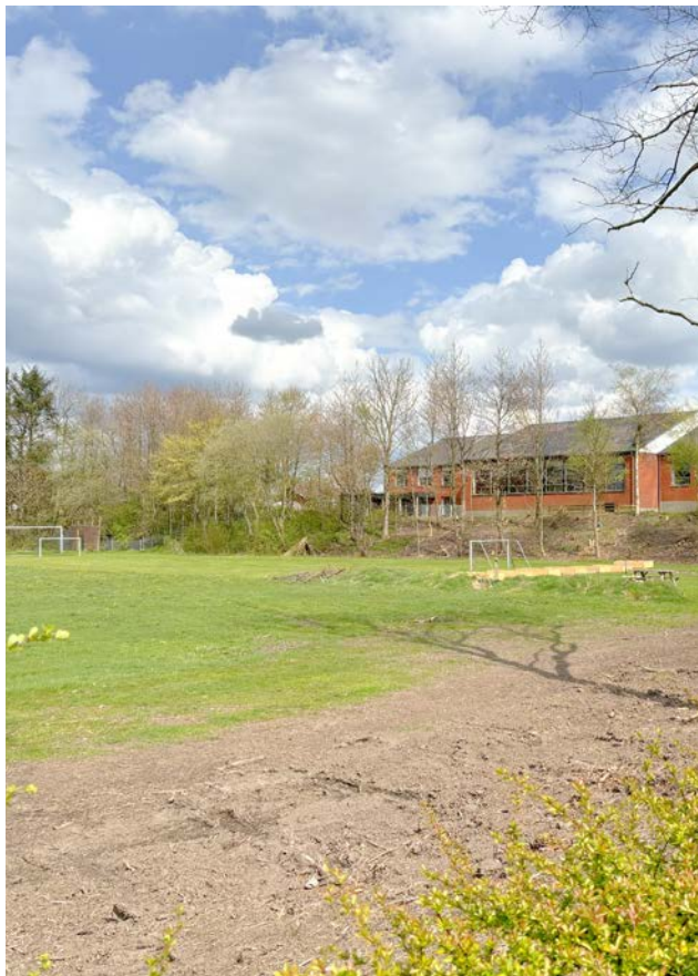
Boldbanerne ved skolen