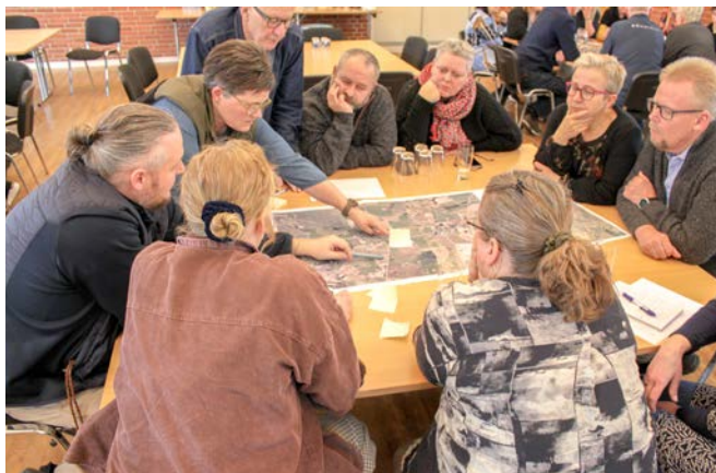
1. borgersamling - øvelse