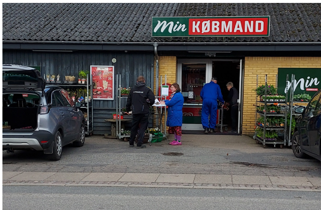
Inddragelse ved Min Købmand i Ravnkilde