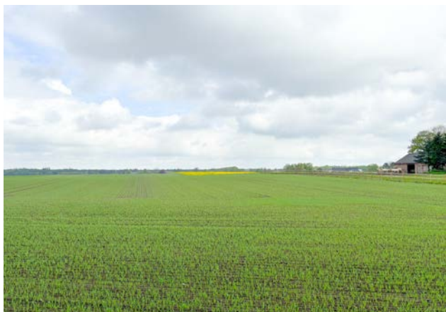
Nord for Ravnkilde, Nørlund Skov i baggrunden