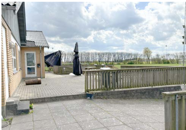
Terrasseareal foran Foreningshuset