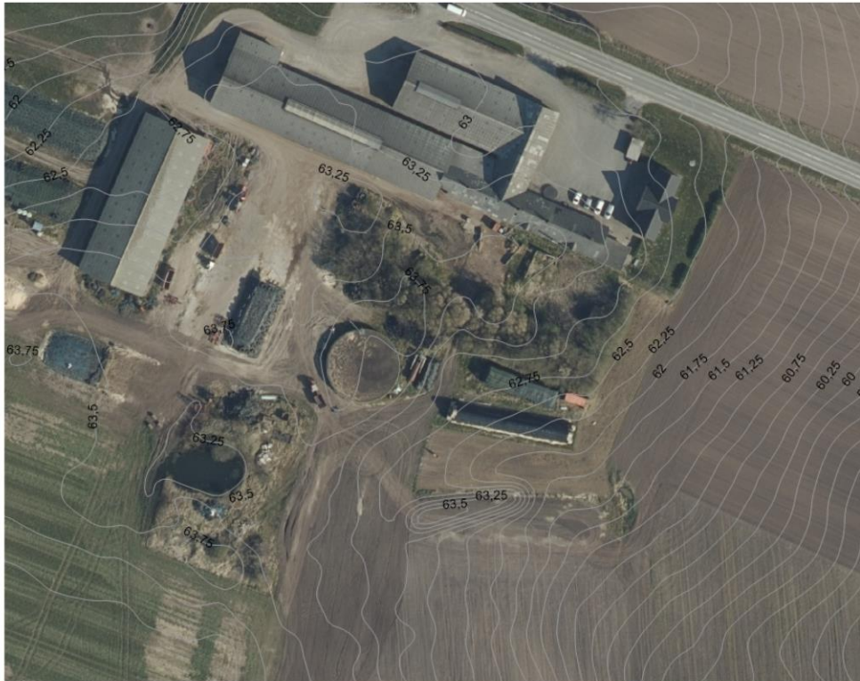
Figur 1. Højdekortet, et klip fra Rebild kommunes GIS kort.