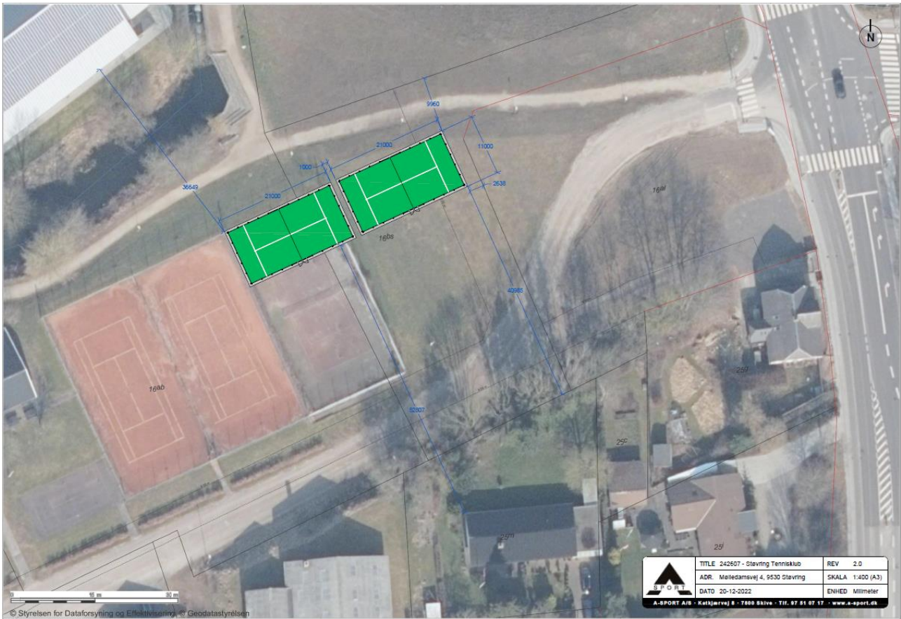
Figur 3 - Placering af de ansøgte tennispadelbaner