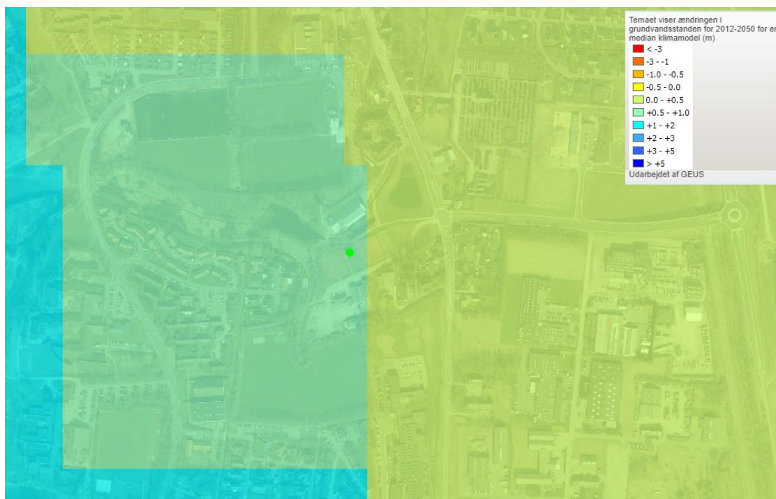
Figur 2 - Grundvandsstand 2050 jf. Klimatilpasningskort

På baggrund af de opstillede vilkår og ved overholdelse af disse vurderer Rebild Kommune samlet set at nedsivning og udledning af overfladevand fra tennispadelbanerne kan ske under gode og kontrollerede forhold, og ikke indebærer væsentlig risiko for forurening af grundvandsressourcer i området.