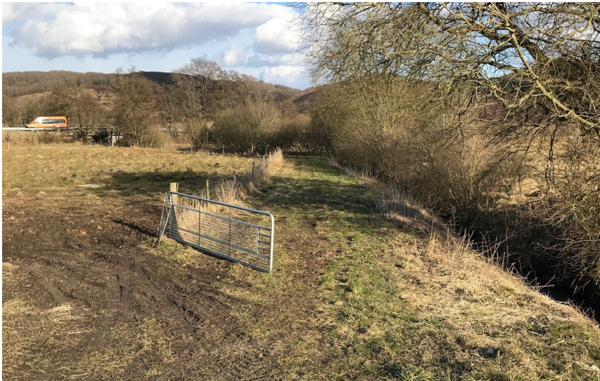
Stien ned mod kanoisætningspladsen.