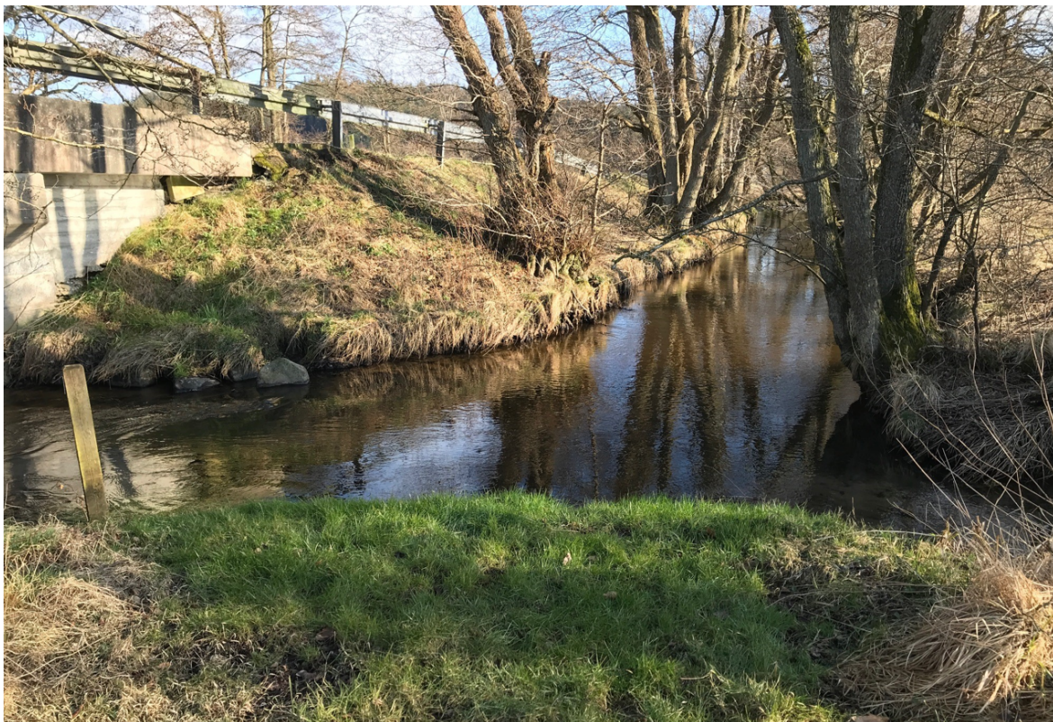
Den ansøgte placering af kanoisætningspladsen i forgrunden. Det nuværende isætningssted ses overfor (vejskråningen nedenfor Vælderskoven).