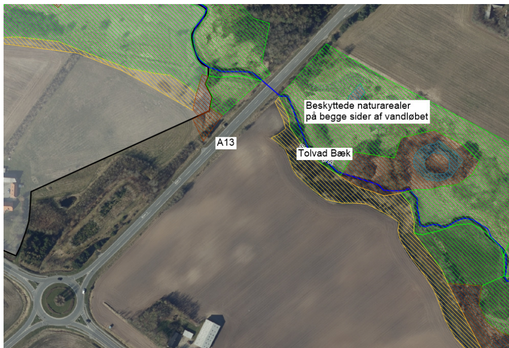
Luftfoto med Tolvad Bæk og de beskyttede arealer på begge sider af vandløbet.