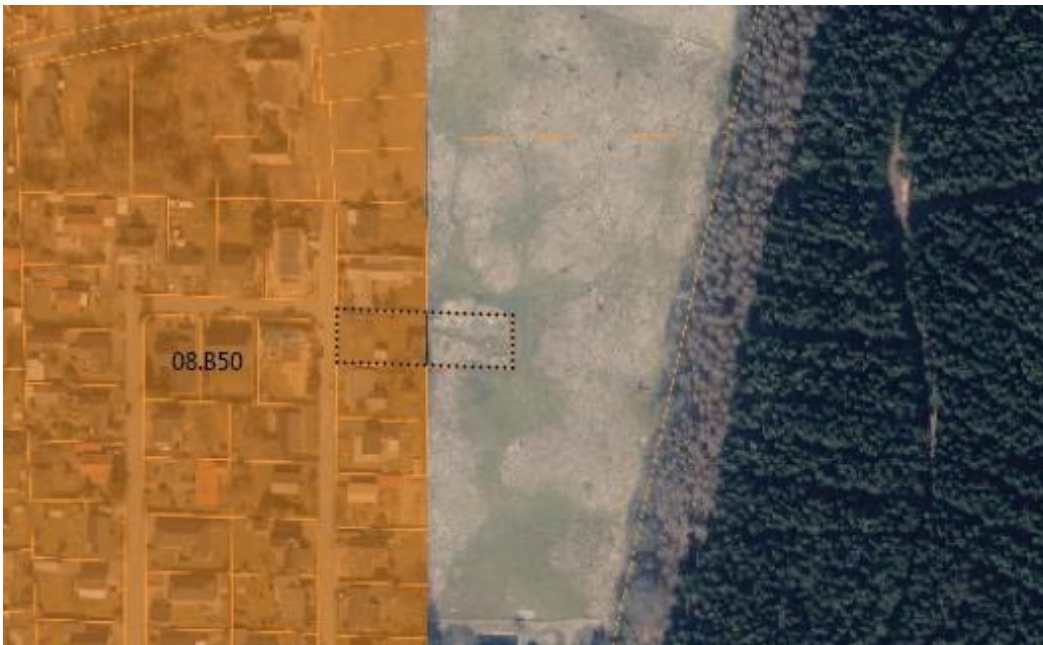
Gældende kommuneplanramme 08.B50 og markering af kommuneplantillæg nr. 17.

Den gældende ramme 08.B50 udlægger en del af området til boligområde med helårsbeboelse. Ny bebyggelse må opføres med højst 2 etager og en bygningshøjde på højst 8,5 m. Bebyggelsesprocenten er højst 30 % for den enkelte grund. Indenfor rammen er der risiko for oversvømmelse, hvorfor øgede befæstelsesgrader skal ses i sammenhæng med den samlede klimaudfordring for Skørping. Rammen regulere ikke udstykning, og der skal etableres private opholdsarealer på 100 % af bruttoetagearealet og fælles opholdsarealer på 10 % af grundarealet.