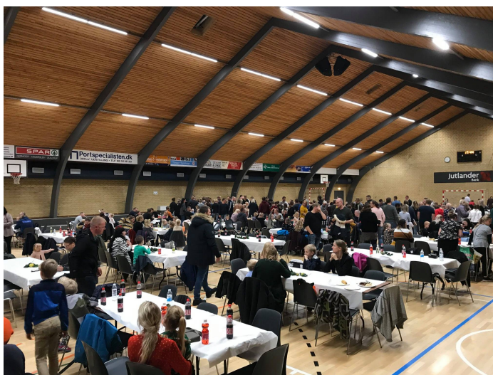
Skolefesterne foregår i hallerne.

Vores største bruger er Sortebakkeskolen, som også er vores nabo. De har 500 elever fra 1. - 9. Klasse og dermed den store skole i Rebild Syd. De bruger hallen i alle dagtimer. Mange af eleverne kommer efter skoletid, hvor de dyrker sport og idræt i en af de mange foreninger, der har til huse er. Det kan være fodbold, indefodbold, håndbold, gymnastik størsteparten af dagtimerne.