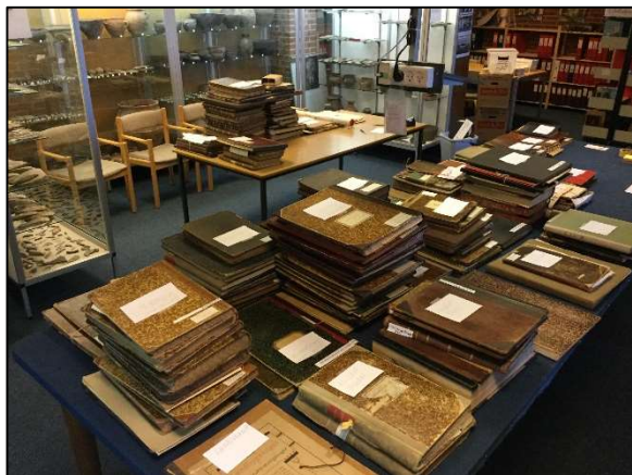
Det fyldte godt op, da de mange protokoller skulle sorteres og registreres