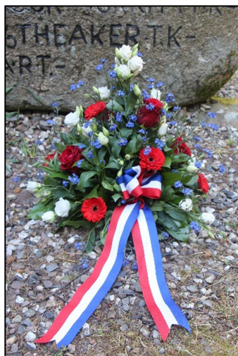
Buket ved Flyverstenen 20. maj