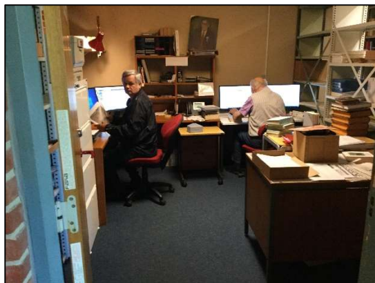
Der registreres bøger en tidlig vintermorgen