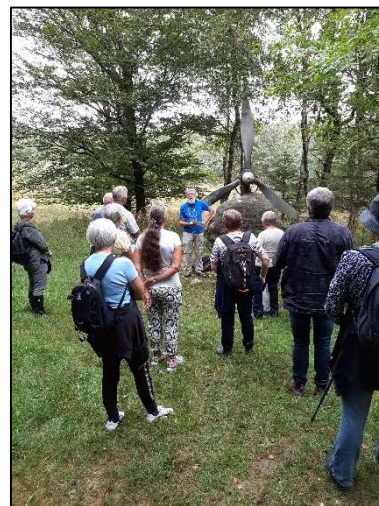
Guidet tur til Flyverstenen en dejlig sommerdag