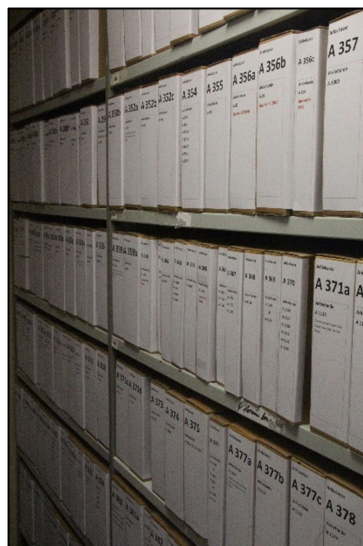
Nogle af de mange hylde-meter arkivalier

Alle Arkivets film/DVD'er er nu lagt på serveren og registrerede på Arkiv.dk, hvilket medfører, at også besøgende nu kan se dem på Arkivet.