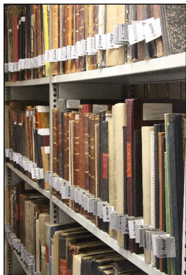
Protokollerne er nu registrerede og sat på plads

Et stort arbejde med at registrere Arkivets omkring 1300 bøger nærmer sig en afslutning. Den store mængde protokoller, der hidtil ikke har været registrerede, er nu kommet med i systemet. Dette arbejde var kun muligt i lukningsperioden, da det var nødvendigt at sortere protokollerne rent fysisk, hvilket krævede megen bordplads, som ikke ville kunne tilvejebringes, hvis Arkivet skulle have fungeret på sædvanlig vis.