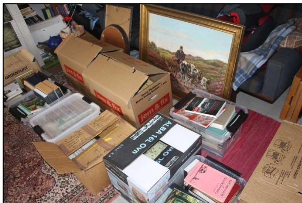
En større indlevering klar til sortering og registrering