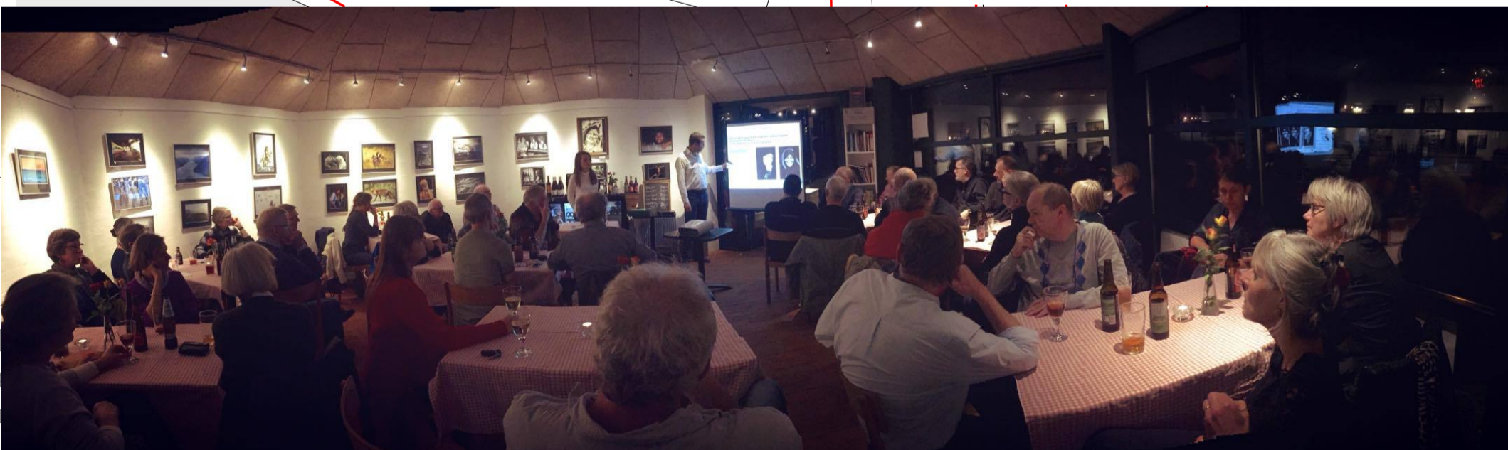
Fredagscafeens popularitet går ofte hårdt ud over iltniveauet i lokalet, som ikke er ventileret. Der er ikke oplukkelige vinduer, så yderdøren er eneste ventilationsmulighed.