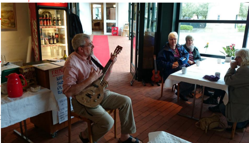
I forbindelsesgangen og Rotunden er gulvet uisolaret med teglsten lagt sand. Rengøringen af det grove gulv giver store udfordringer.