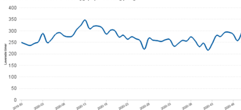
Leverede timer i den udekørende sygepleje - udvikling pr. uge

Vi vurderer, at sygeplejen kommer til at bruge ca. 2,1 mio. kr. mere end deres korrigerede budget. Den udekørende sygepleje har fået overført 0,6 mio. kr. i merforbrug fra 2019.