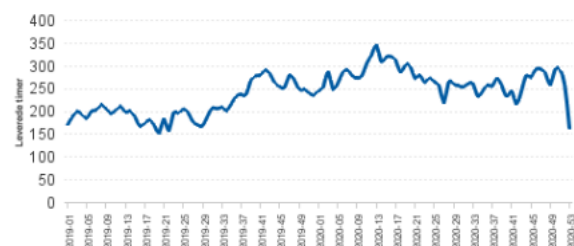
Leverede timer i den udekørende sygepleje - udvikling pr. uge

Som grafen viser nedenfor, har der været en generel opdrift i leverede timer, hvilket også er en forklarende årsag til merforbruget.