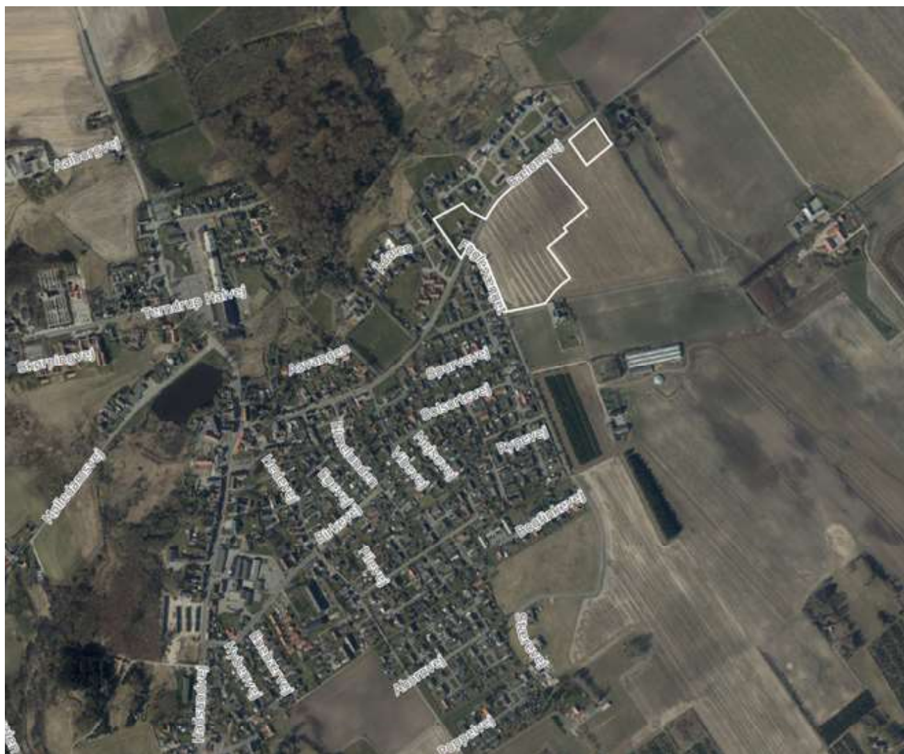
Lokalplanens område. Luftfoto 2020.

Lokalplanområdet ligger i den østlige del af Terndrup, syd for Bælumvej og øst for Fuglevænget. Mod vest og nord ligger der parcelhusområder. Mod nord ligger parcelhusområdet Anemonelunden og nord for dette ligger ådalen omkring Skibested/Lyngby Å samt skoven Terndruplund. Ådalen er udpeget som et større sammenhængende landskab, som strækker sig til Bælumvej.