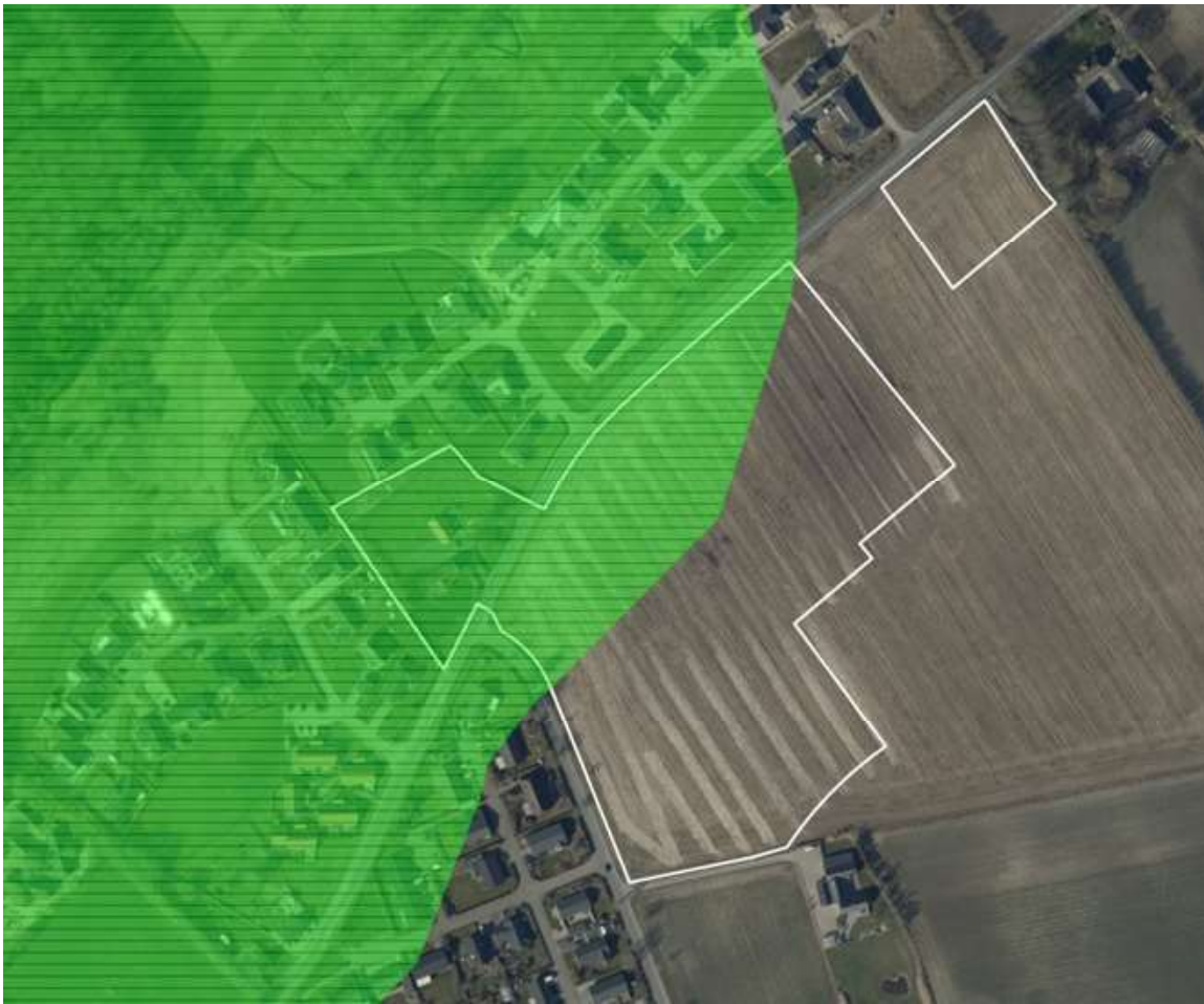
Den grønne markering angiver skovbyggelinjen.