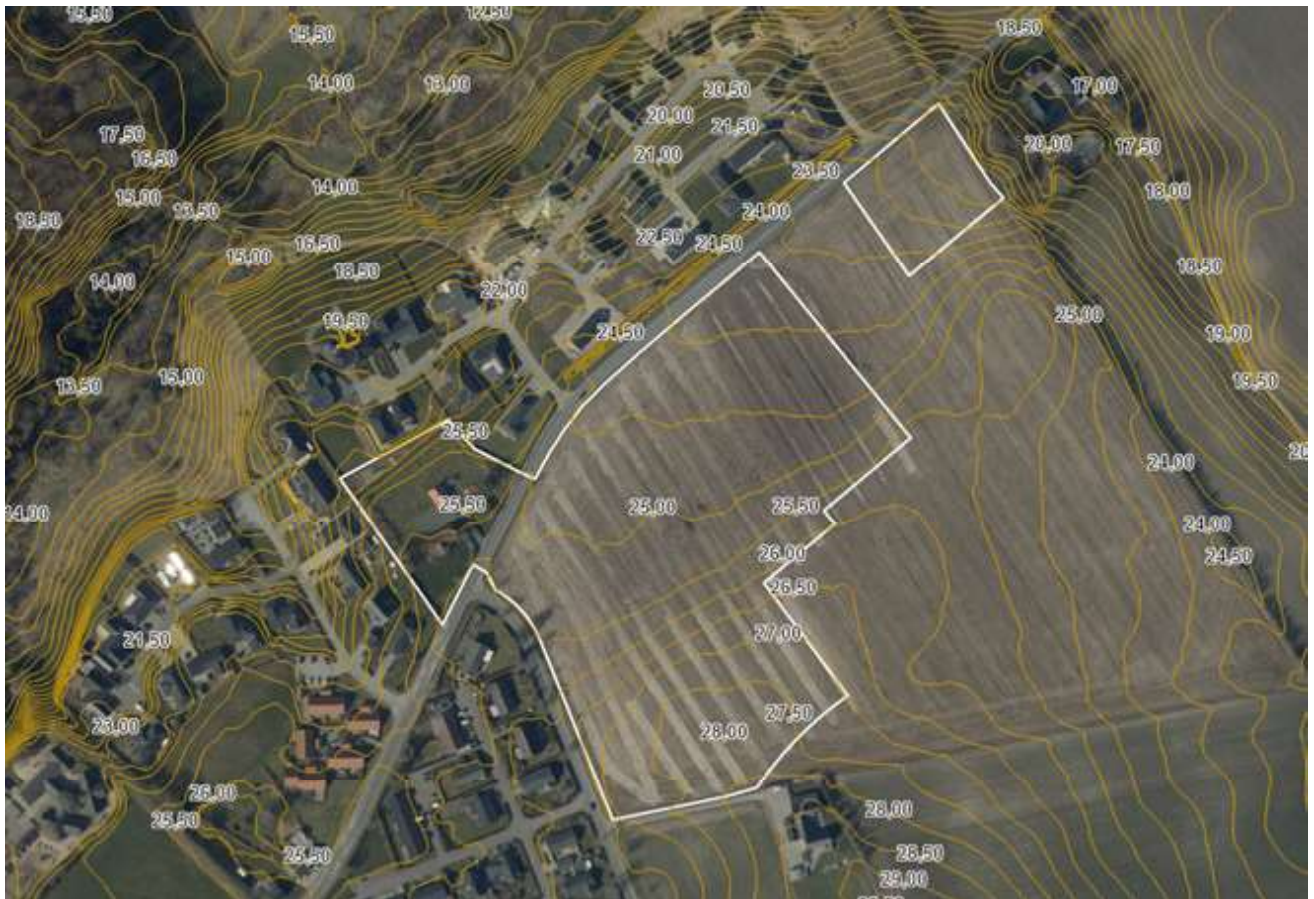
Kort over det naturlige terræn med 0,5 m højdekurver.