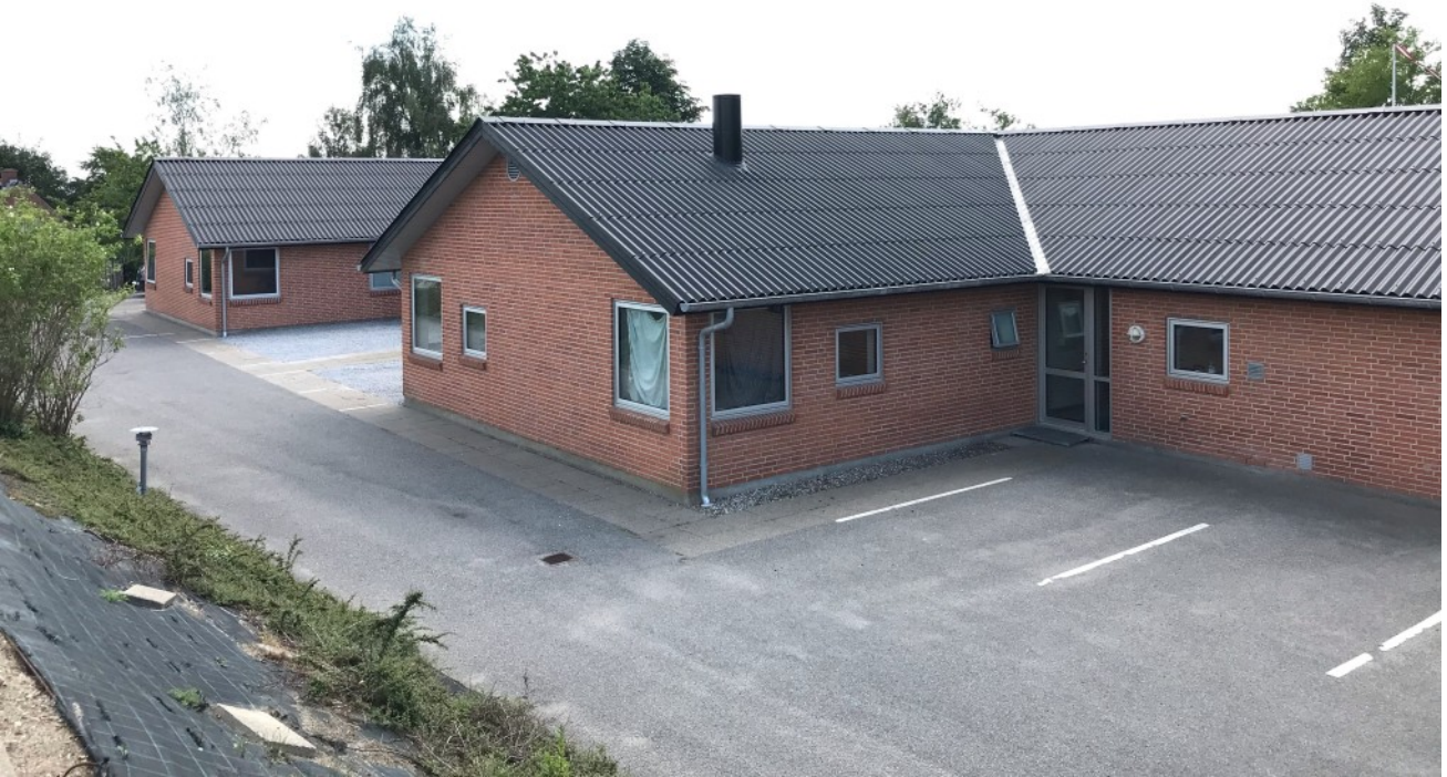
Den eksisterende bygning indenfor lokalplanområdet.