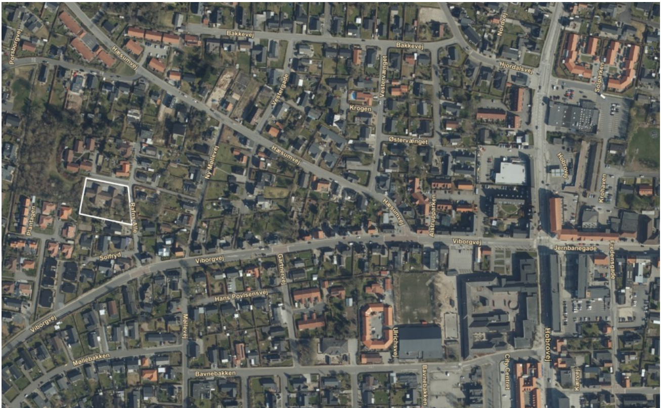
Lokalplanens område. Luftfoto 2020.

Lokalplanområdet er beliggende tæt på centrum. Rafns Alle munder ud i Viborgvej, som er en af de overordnede trafikveje i Støvring. Viborgvej leder ud i Høbrovej, og skifter efterfølgende navn til Jernbanegade.