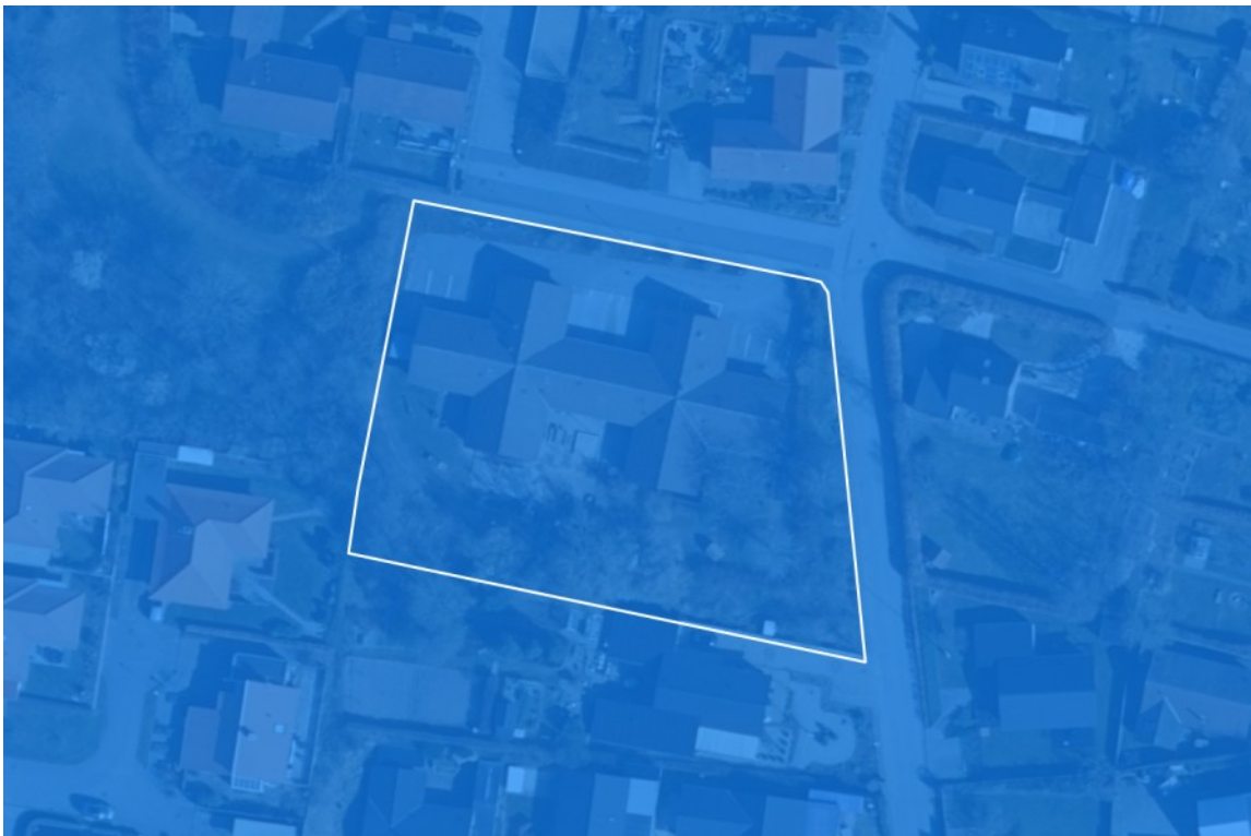
Billedet viser større sammenhængende landskaber.

Hele lokalplanområdet er omfattet af større sammenhængende landskaber. Lokalplanens bebyggelsesregulerende bestemmelser og bestemmelser om terrænregulering tager hensyn til landskabspåvirkningen, således at den mindskes mest muligt. Derfor vurderes det, at lokalplanen er i overensstemmelse med retningslinjen.