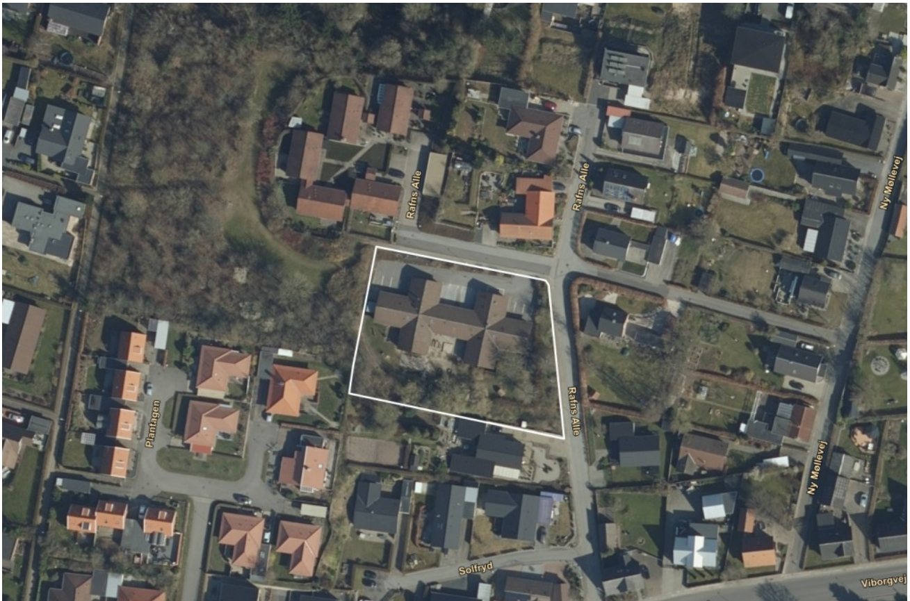
Lokalplanens område. Luftfoto 2020.

Lokalplanens område er beliggende i den vestlige del af Støvring på Rafns Alle, og har et areal på ca. 0,29 ha. Lokalplanområdet afgrænses mod nord og øst af vejen Rafns Alle. Mod syd afgrænses lokalplanområdet af en boliggrund. Mod vest afgrænses området af et grønt område.